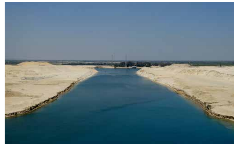
Slika 1. Prokapanjem Sueskog kanala omogućilo se širenje invazivnih stranih vrsta iz Crvenog u Sredozemno more

Navedenih se šest kategorija prema Konvenciji o biološkoj raznolikosti dijeli na potkategorije odnosno putove unosa koji su uz kratka pojašnjenja navedeni u tablici 1.