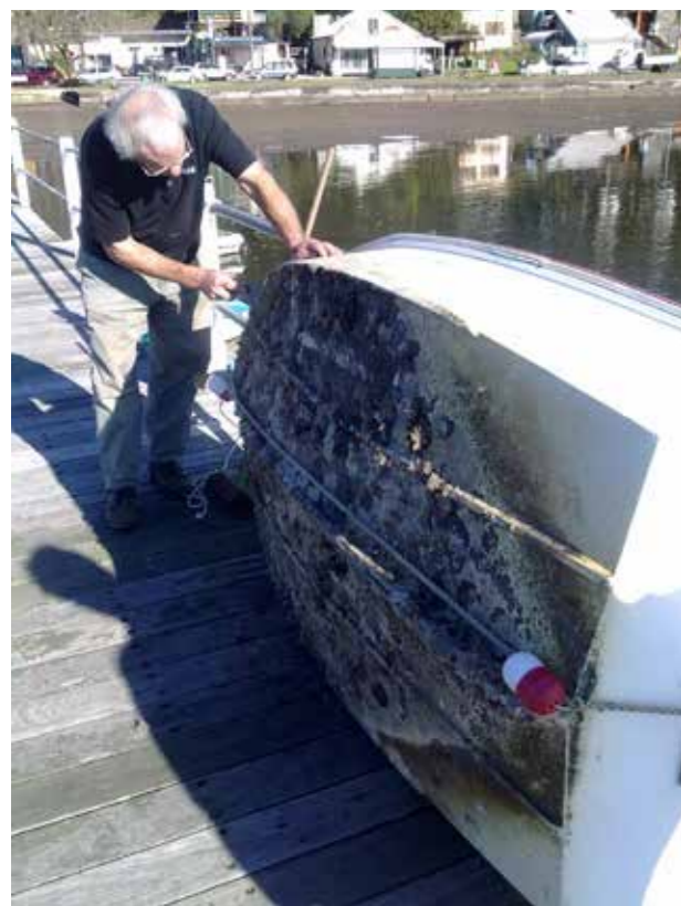
Slika 3. Uklanjanje biljnog i životinjskog materijala s trupa čamca