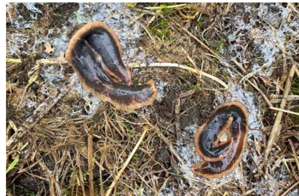
Slika 2. Velik broj vrsta unosi se slučajno kao kontaminacija zemlje npr. invazivni virnjak iz Novog Zelanda ( Arthurdendyus triangulatus ) koji se hrani gujavicama