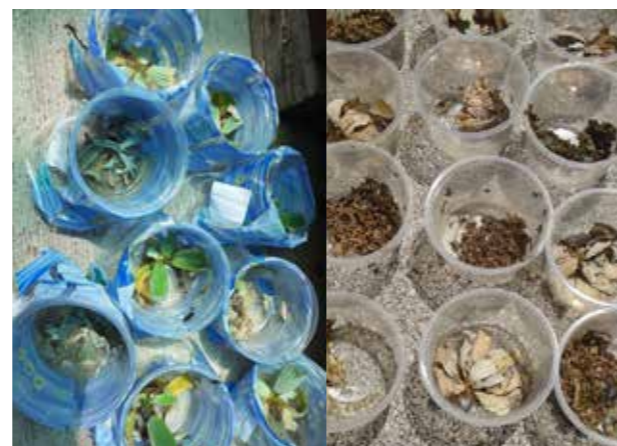
Slika 4. Propisno uništavanje invazivnih vodenih biljaka sušenjem

Treba se provoditi pažljivo kako vodene biljke ne bi dospjele u rijeke, vodene putove ili mora. Metode koje se mogu koristiti za njihovo odlaganje su: kompostiranje i zakapanje, sušenje ili sušenje zamrzavanjem i naknadno sigurno odlaganje.