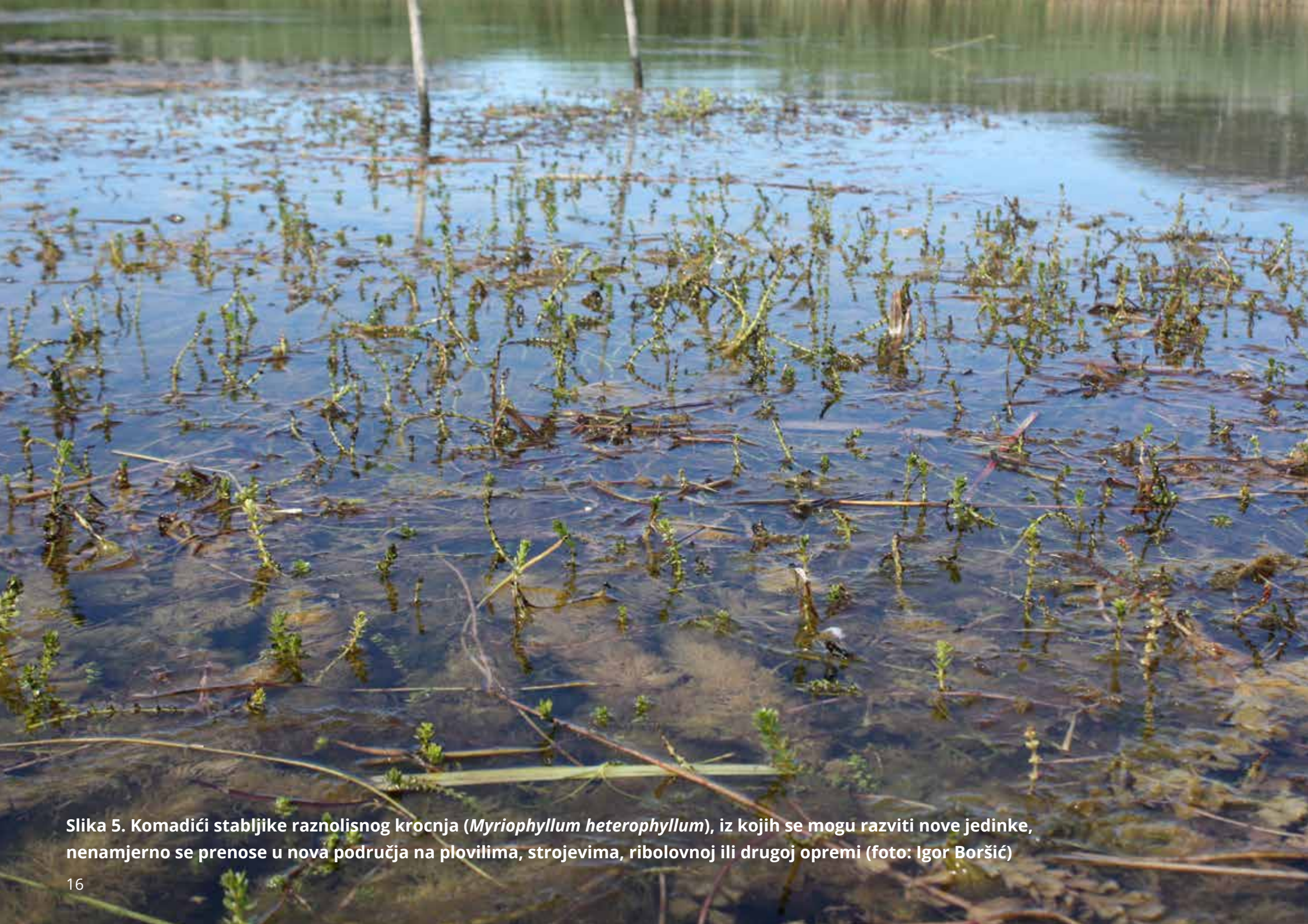
Slika 5. Komadići stabljike raznolisnog krocnja ( Myriophyllum heterophyllum ), iz kojih se mogu razviti nove jedinke, nenamjerno se prenose u nova područja na plovilima, strojevima, ribolovnoj ili drugoj opremi