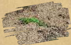
Gušter zelembac ( Lacerta viridis )