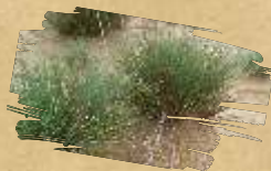
Sivkasta gladica ( Corynephorus canescens )