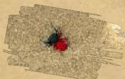
Ladybird spider ( Eresus kollari )