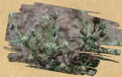
Pješčarski trputac ( Plantago indica )