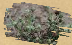
Indian plantain ( Plantago indica )