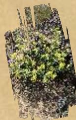
Field pansy ( Alyssum montanum ssp. gmelinii )