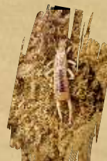
Sand earwig ( Labidura riparia )