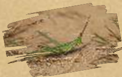
Nosata šaška ( Acrida ungarica )