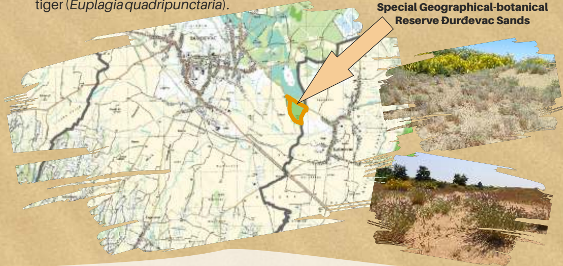
Special Geographical-botanical Reserve Đurđevac Sands

Pannonic sand steppes, Natura 2000 code: 6260*, and the species is a butterfly the Jersey tiger ( Euplagia quadripunctaria ).