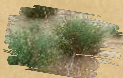
Gray hair grass ( Corynephorus canescens )