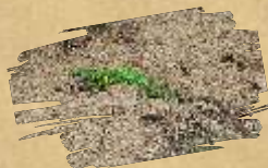
Large lizard ( Lacerta viridis )