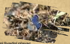
Obični livadni plavac ( Polyommatus icarus )