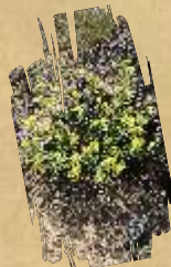
Gmelinijeva gromotulja ( Alyssum montanum ssp. gmelinii )