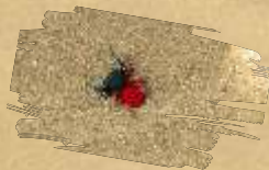
Crni cjevasti pauk ( Eresus kollari )