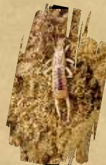
Pješčarska uholaza ( Labidura riparia )