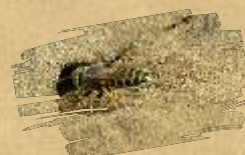
Digger wasp ( Bembex rostrata )