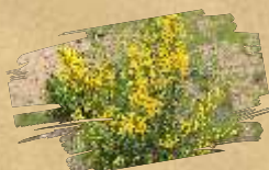
Broom ( Cytisus scoparius )