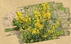
Zečjak ( Cytisus scoparius )