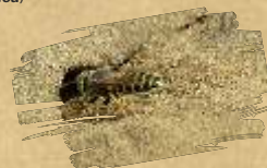
Osa kopačica ( Bembex rostrata )