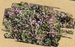
Wild thyme ( Thymus serpyllum )